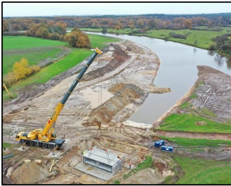
Plaatsen elementen voor inlaatwerk nevengeul