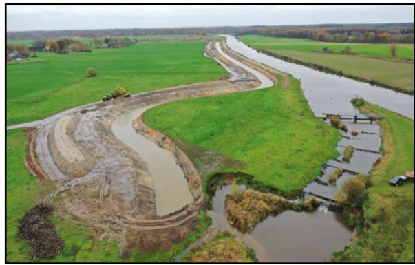
Aansluiting nieuwe nevengeul op bestaande nevengeul